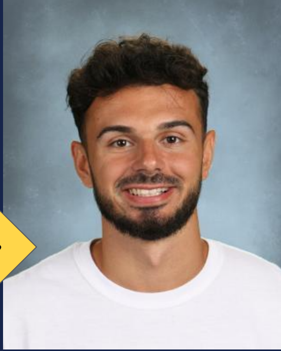
مسٹر میک .P.E.