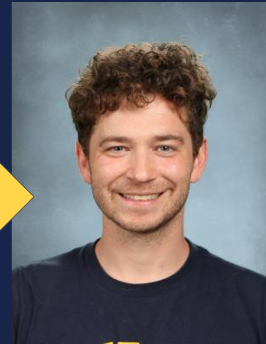
ایمیکس روبی سوشل اسٹڈیز