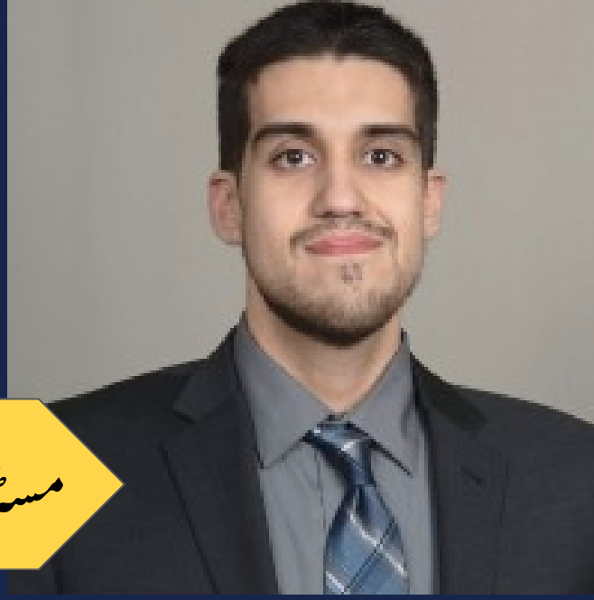
مسٹر کا سٹیلو یتھ