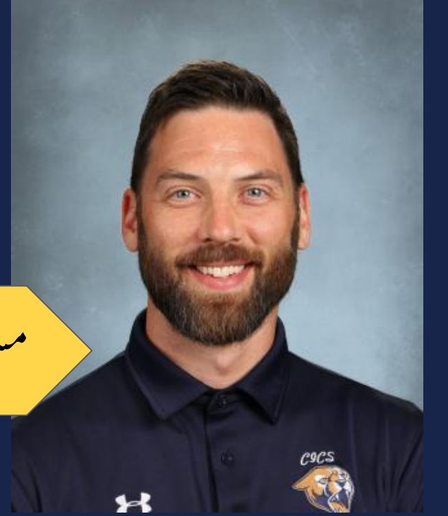
مسٹر سٹریبل سائنس